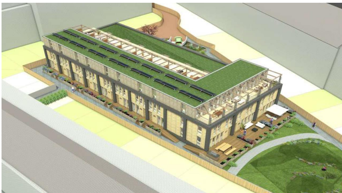
Impressie project 'Stadsbad'

Burgemeester en wethouders zijn voornemens om ten behoeve van deze ontwikkeling een omgevingsvergunning te verlenen, waarbij wordt afgeweken van het bestemmingsplan. U wordt in de gelegenheid gesteld om zienswijzen in te dienen ten aanzien van het voornemen om voor deze ontwikkeling een omgevingsvergunning te verlenen.